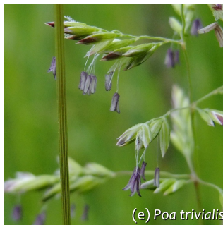
(e) Poa trivialis