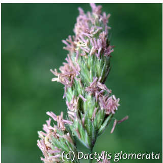
(d) Dactylis glomerata