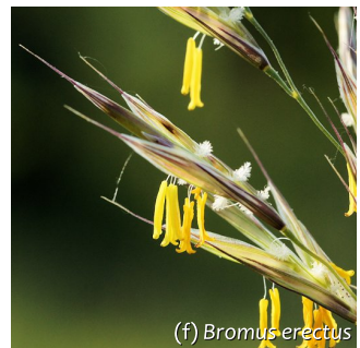
(f) Bromus erectus