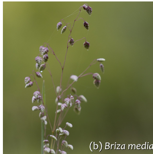
(b) Briza media